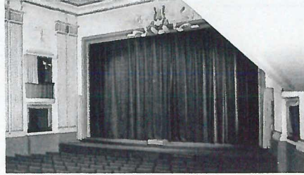
Teatersalen slik den ble pusset opp av tyskerne.