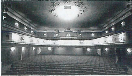
Teatersalen i Stortingsgaten 16 med Terbovens losje.