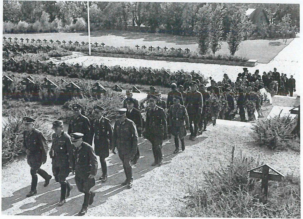
Tysk gravfølge på æreskirkegården på Ekeberg i Oslo. Datering 1943-44.