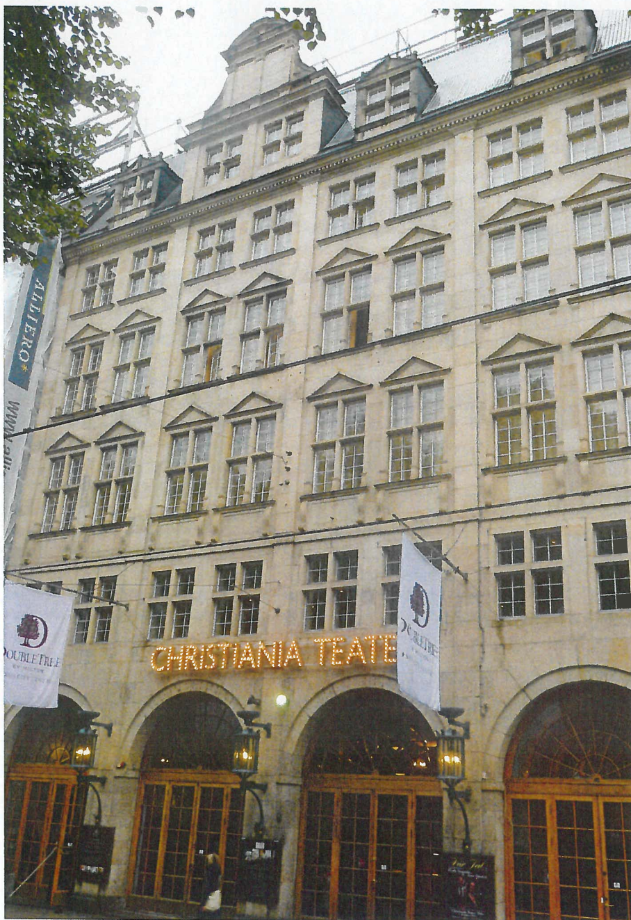
Stortingsgaten 16, ombygget og innredet til okkupasjonsmaktens teaterscene, Deutsches Theater i 1941.

Teatersalen i Stortingsgaten 16 ble ominnredet av tyskerne. Salen ble rikere dekorert, og det ble etablert egen losje for Josef Terboven på balkongen med inngang fra øvre lobby. Fra lobbyen førte en tofløyet dør inn til losjen. Det kan imidlertid være verdt å merke